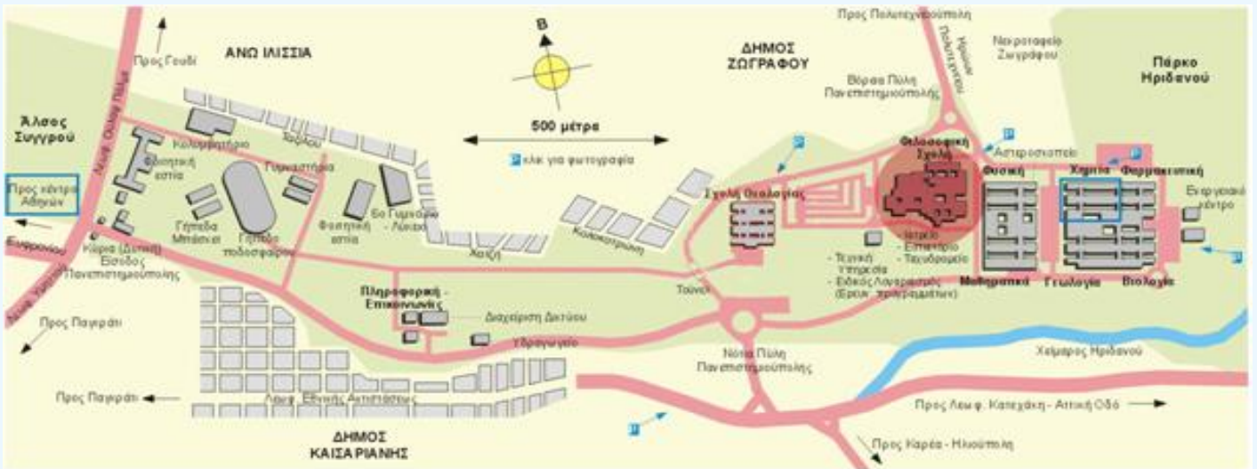
Χάρτης της Πανεπιστημιούπολης

Διαδραστικοί χάρτες των εγκαταστάσεων του Πανεπιστημίου Αθηνών: http://maps.uoa.gr/