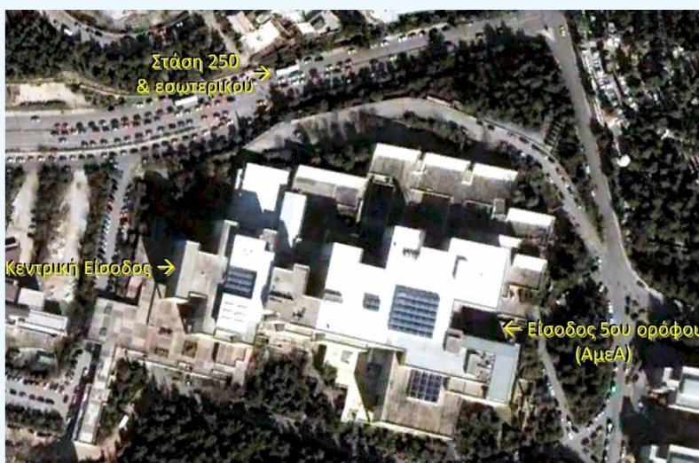
Αεροφωτογραφία του κτηρίου της Φιλοσοφικής Σχολής και του περιβάλλοντος χώρου