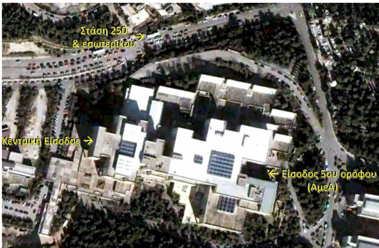
Αεροφωτογραφία του κτηρίου της Φιλοσοφικής Σχολής και του περιβάλλοντος χώρου

Διαδραστικοί χάρτες των εγκαταστάσεων του Εθνικού και Καποδιστριακού Πανεπιστημίου Αθηνών είναι διαθέσιμοι μέσω του ιστοτόπου του ΕΚΠΑ ( https://maps.uoa.gr/ )